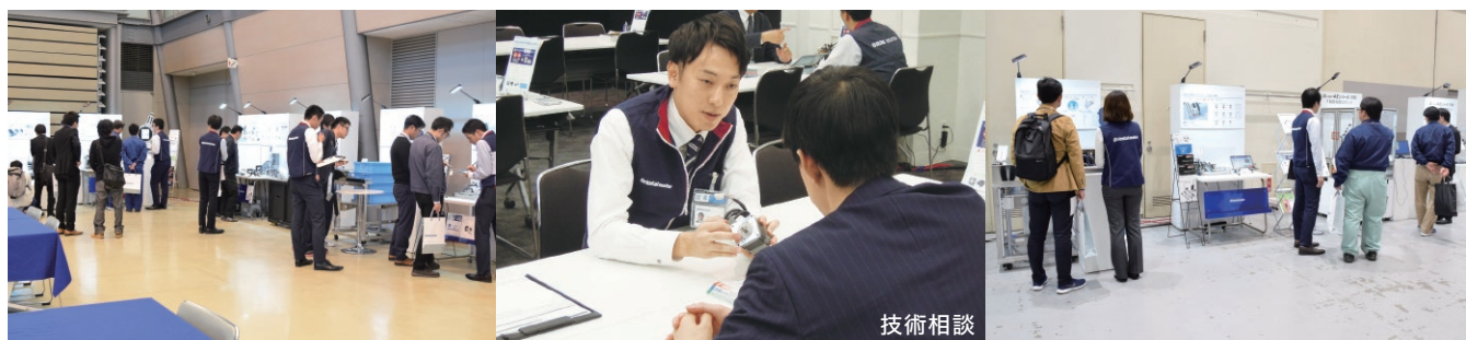
過去のモーターフェアの様子